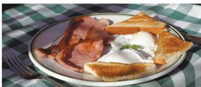
▲ Œufs au bacon

Pour privilégier le contact, nous vous suggérons la formule traditionnelle de logement en Bed & Breakfast ou « Chez l'habitant ». C'est la garantie d'un accueil chaleureux, d'un logement confortable et soigné, avec le fameux petit-déjeuner irlandais : jus d'orange, thé ou café, pain grillé et céréales, mais aussi les œufs au bacon et les saucisses !